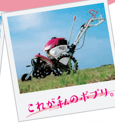
これが私のポプリ。